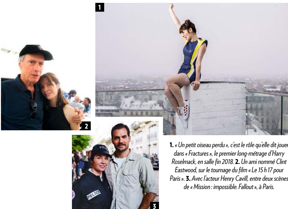
1. «Un petit oiseau perdu», c'est le rôle qu'elle dit jouer dans «Fractures», le premier long-métrage d'Harry Roselmack, en salle fin 2018. 2. Un ami nommé Clint Eastwood, sur le tournage du film «Le 15 h 17 pour Paris». 3. Avec l'acteur Henry Cavill, entre deux scènes de «Mission : impossible. Fallout», à Paris.